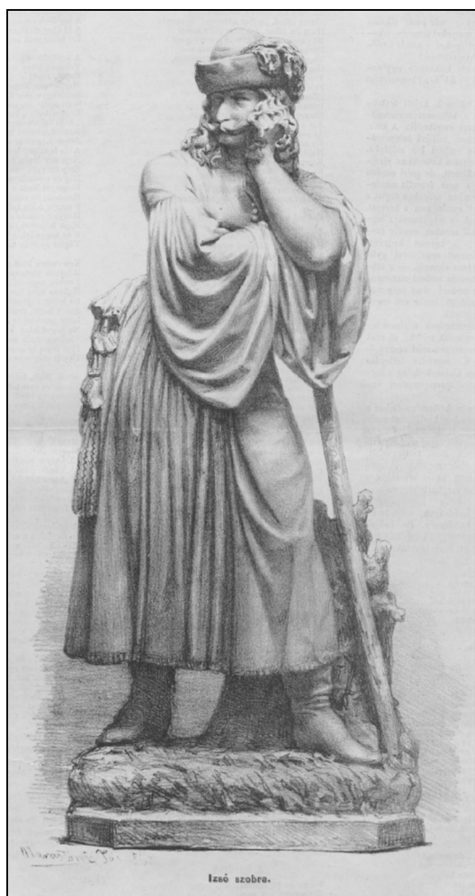
[Marastoni József rajza.] (Az Ország Tükre, 1. évf., 1862. 3. sz., febr. 1., 42. old.)